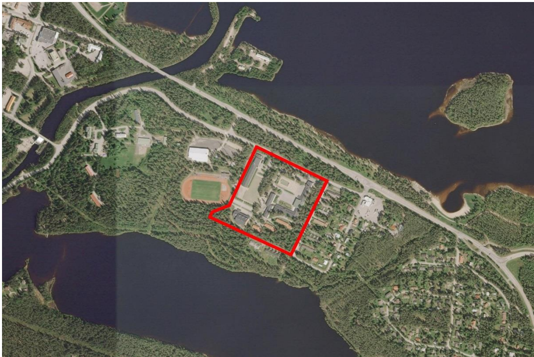
Suunnittelualueen raja. (Ortokuva MML karttapaikka)

Suunnittelualueella sijaitsevat Ruukinkankaan koulu, Suomussalmen lukio ja Suomussalmen liikuntahalli. Alueen kaakkoiskulmalla on kolme opettajien rivitaloiksi rakennettua asuinrakennusta.