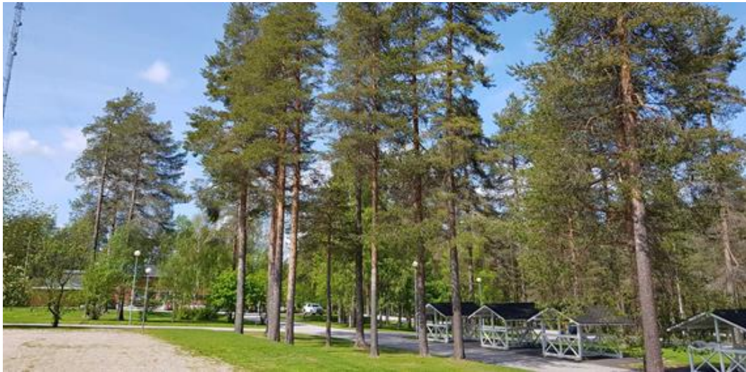
Koulun alueella on monin paikoin komeaa, säilyttämisen arvoista puustoa.

Asemakaavan laadintaa ohjaavat koulun alueella vuoden 2020 alussa valmistuneet koulu- suunnitelmat.