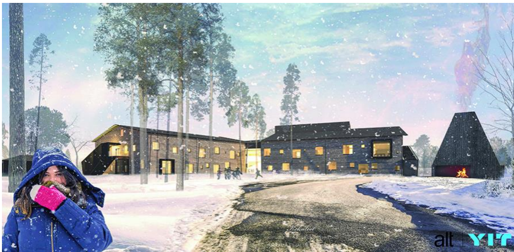
Havainnekuva uudesta koulusta julkaistiin Suomussalmen kunnan internet-sivuilla 25.2.2020.